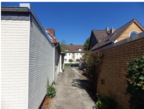
Durchgang zum Garten und Garagen